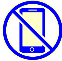
携帯電話 スマートフォン