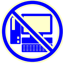
パソコン ゲーム機