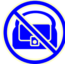
ハンドバッグの 留め具